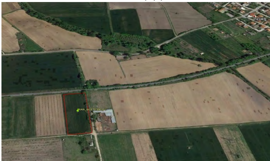
Εικόνα 1: Απεικόνιση Ακινήτου Από Την Περιφερειακή Ενότητα Ξάνθης

Οι ενδιαφερόμενοι μπορούν, επίσης, να αναζητήσουν τα διαθέσιμα ακίνητα της βάσης δεδομένων απευθείας από την Επιτροπή Θεμάτων Γης και Επίλυσης Διαφορών της οικείας περιφέρειας. Ομοίως, μπορούν να υποβάλουν την αίτησή τους όχι μόνο ηλεκτρονικά μέσω της ειδικής διαδικτυακής πλατφόρμας, αλλά και με φυσική παρουσία στην εκάστοτε επιτροπή.