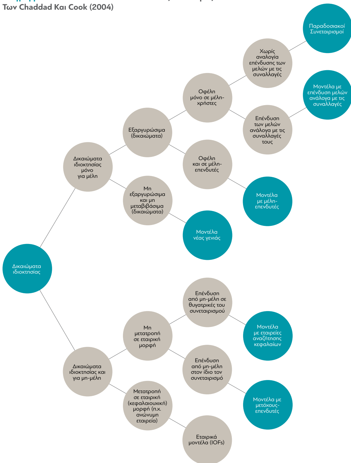
Διάγραμμα 2: Εναλλακτικά Μοντέλα Βάσει Της Τυπολογίας Των Chaddad Και Cook (2004)

Όπως βλέπουμε στο σχετικό διάγραμμα, στην κορυφή της πρώτης ομάδας, στην οποία τα δικαιώματα ιδιοκτησίας περιορίζονται στα μέλη-χρήστες, βρίσκεται το κλασικό «παραδοσιακό μοντέλο» του 20ού αιώνα που περιγράψαμε πρωτύτερα (traditional cooperatives).